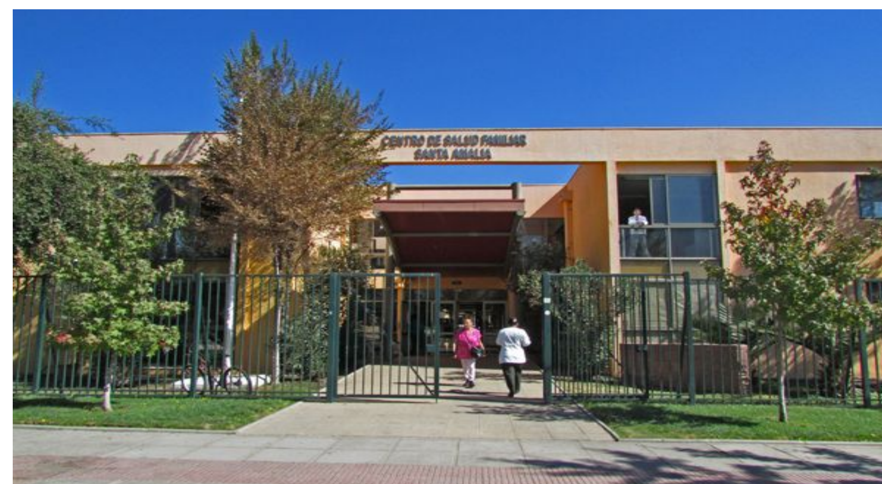
Consultorio Santa Amalia

El proyecto tiene como objetivo cubrir al 0,16% de los usuarios del consultorio participante. Al tercer año se pretende abarcar un 0,3% de los beneficiarios del centro de salud.